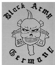
Colour: „Black Army Germany“