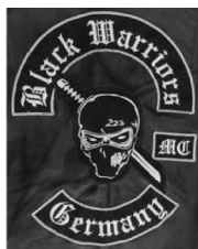
Colour: „Black Warriors MC Germany“